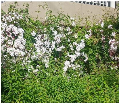
管理棟前のジャスミン

下の写真は高坂の松風公園のキンランと千年谷公園のカワラヒワ親子の写真です、この高坂の松風公園と千年谷公園にも数回訪れています。この広報を発行するころにはキンランとギンランが見ごろを迎えそうです、松風公園では6月中旬からヘイケボタルが見られます。また、今月下旬からは江南総合文化会館ピピアの駐車場のそばでゲンジボタルも見ることができます。東松山市やこの周辺にはまだまだ自然が豊かで住みやすい場所だと感じました。これからも健康に気を付け楽しくウォーキングをしていこうと思います。最後に近隣で咲いている花や鳥の写真を載せてみました。