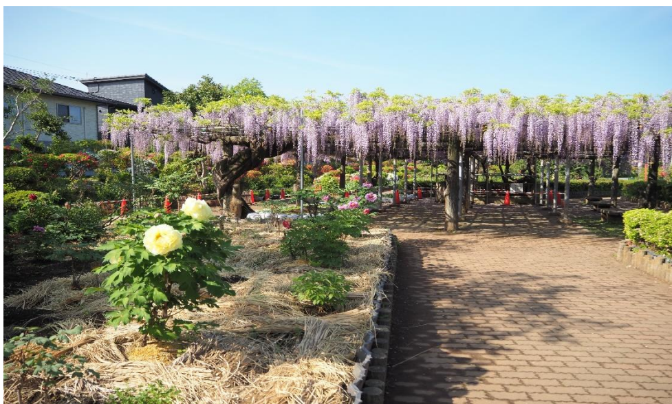
箭弓稲荷神社 ボタンとフジ