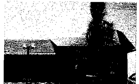
市民福祉センター (ソラーナ)