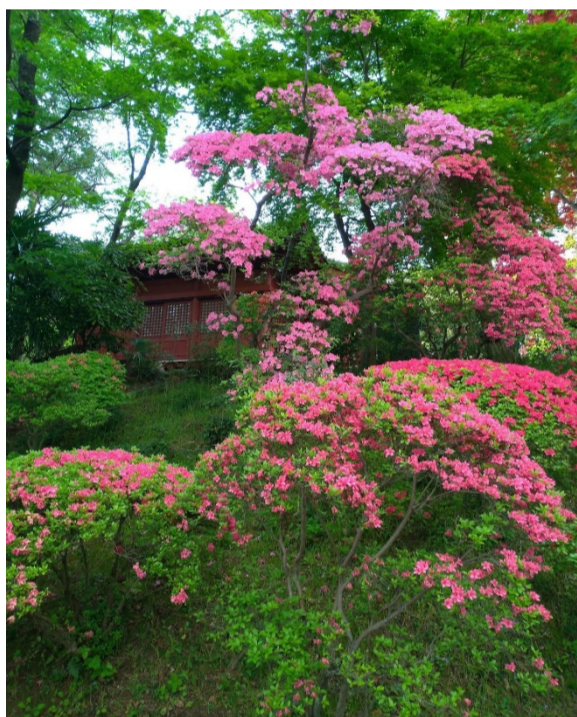
春のツツジは、一見の価値あります